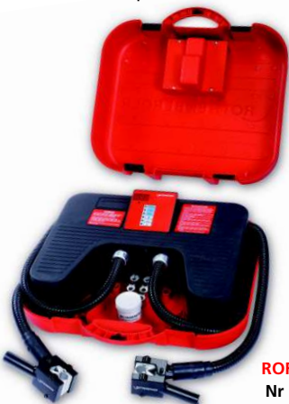
ROFROST ECO Nr 1500000089

Najnowsze urządzenie do zamrażania rur o mocy 700W. Kompaktowe urządzenie, bez użycia czynnika chłodzącego, do pracy na rurach miedzianych, stalowych i wielowarstwowych Ø 8 - 22 mm. Pełna kontrola procesu mrożenia na elektronicznym panelu LED.