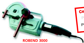
ROBEND 3000 Nr 2.5705X