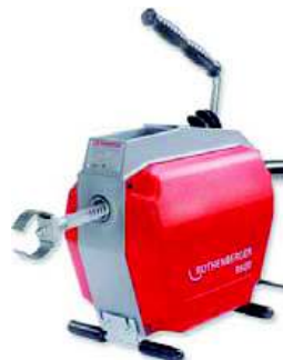
R 600 z wyposażeniem Nr 1.9173

✓ W komplecie zestaw spiral i narzędzi Ø 16 / 22 mm