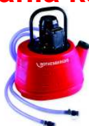
ROCAL 20 Nr 6.1100

Przeznaczone do szybkiego odkamieniania wymienników i systemów rurowych