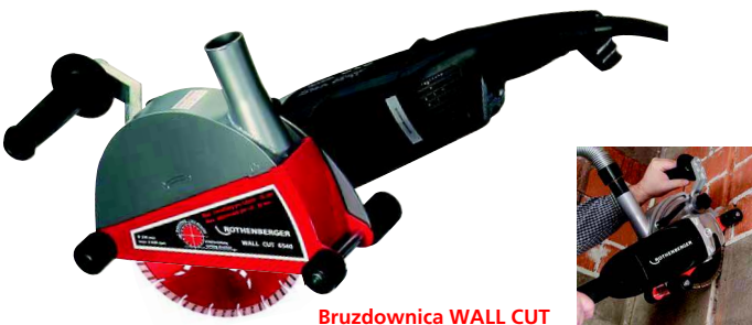
Bruzdownica WALL CUT Nr FF40040

Zestaw (nr FF40040) składa się z : bruzdownicy Wall Cut 6540 (nr FF40040) z 2-tarczami tnącymi o średnicy Ø 230 mm (nr FF11230), przecinakami (nr 7.7151), kluczem 2-oczkowym (nr FF70088)