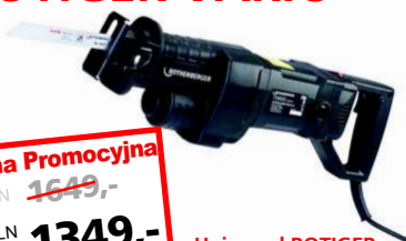
Universal ROTIGER Vario Electronics Nr 5.0301