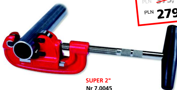
SUPER 2" Nr 7.0045