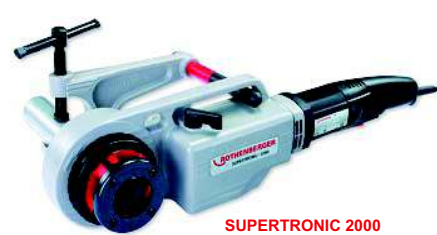
SUPERTRONIC 2000 Nr 7.1256