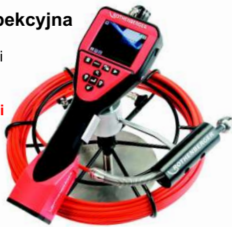
Kamera ROSCOPE 1000 zestaw PIPE 25/22 Nr 1000000009

W ZESTAWIE MODUŁ TEC 17 / 90 cm GRATIS !!!