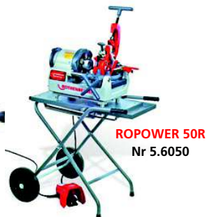
ROPOWER 50R Nr 5.6050