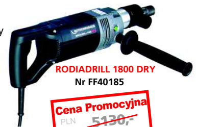
RODIADRILL 1800 DRY Nr FF40185

Można bez zmęczenia wiercić otwory w ścianach wykonanych z twardej cegły silikatowej.