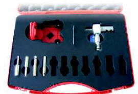
Zestaw koronek Nr 1.9320

Zestaw (nr 1.9320) zawiera: koronki galwanoplastyczne 6 - 8 - 10 - 12 mm, uchwyt do wiertarki, przysawkę z układem centrującym walizkę narzędziową z tworzywa sztucznego.