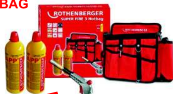
JUŻ WKRÓTCE SUPER FIRE 3 HOTBAG Nr 1000000144

Zestaw (nr 1000000144) składa się z: uchwyty palnika (nr 3.5445), palnika cyklonowego (nr 3.5457), 2 szt. pojemników z gazem MAPP® (nr 3.5551-C), całość skompletowana w poręcznej torbie narzędziowej