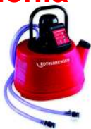
ROMATIC 20 Nr 6.1190