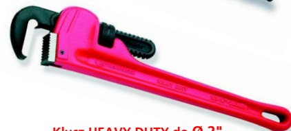
Klucz HEAVY DUTY do Ø 2” Nr 7.0153