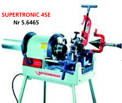
SUPERTRONIC 4SE Nr 5.6465

Przeznaczona do szybkiego i łatwego wykonywania precyzyjnych, zgodnych z normami i pewnych gwintów rurowych i śrubowych do 2", 3" i 4".