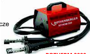
ROTHERM 2000 Nr 3.6702

IDEALNY ZESTAW DO PRAC W TRUDNYCH WARUNKACH