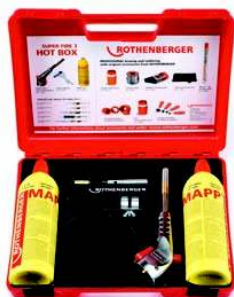
SUPER FIRE 3 HOT BOX Nr 3.5490-C

Zestaw (nr 3.5490) składa się z: uchwyty palnika (nr 3.5445), palnika cyklonowego (nr 3.5457), palnika precyzyjnego (nr 3.5455), odbijacza płomienia (nr 3.1043), podstawki (nr 3.5461), 2 szt. pojemników z gazem MAPP® (nr 3.5551-C).