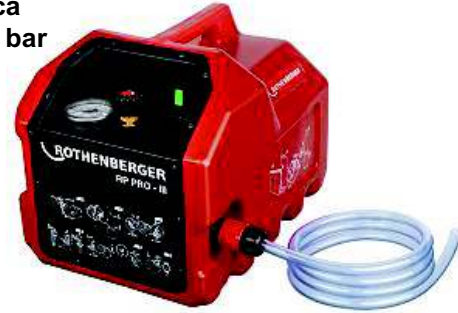
Pompa RP Pro III Nr 6.1185

Przeznaczona do prób ciśnieniowych rurociągów i zbiorników w instalacjach sanitarnych i grzewczych.