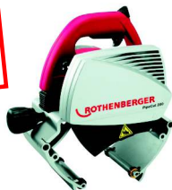
PIPECUT 220 U Nr 5.6712