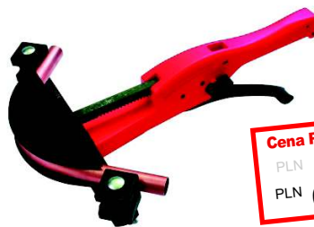
TUBE BENDER MAXI Nr 2.3020

Jednoręczna giętarka do precyzyjnego gięcia rur z miedzi i rur wielowarstwowych do 90°, Ø 12 - 22 mm