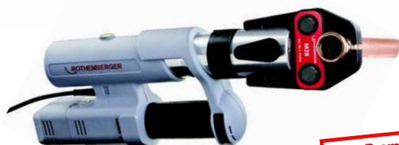
ROMAX® AC ECO zestaw bez szczęk Nr 1.5705