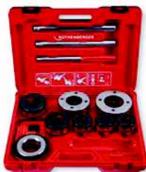
SUPER CUT 2 Nr 7.0892X

Zestaw SUPER CUT 2" (Nr 7.0892X) zawiera: gwintownicę z grzechotką 2", adapter, szybkowymienne głowice gwinciarckie od 1/2" - 2" skompletowane w walizce z tworzywa sztucznego.