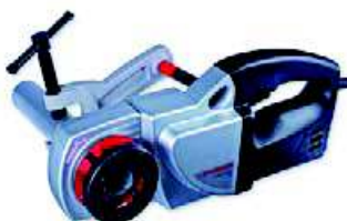
SUPERTRONIC 1250 Nr 7.1450

Gwintownice elektryczne do 1.1/4" ( SUPERTRONIC 1250 ) lub do 2" ( SUPERTRONIC 2000 ) przeznaczone są do szybkiego i łatwego wykonywania precyzyjnych, zgodnych z normami i pewnych gwintów