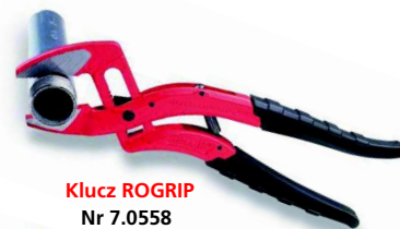
Klucz ROGRIP Nr 7.0558