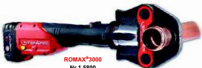
ROMAX®3000 Nr 1.5800

Zaciskarka elektrohydrauliczna z zasilaniem sieciowym 230 V/50-60 Hz do zaciskania złączek o średnicach do Ø 54 mm Dzięki zastosowaniu technologii CFT® stała siła zacisku 32 kN.